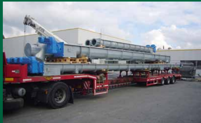
Förderweg Klärschlammprojekt Moskau