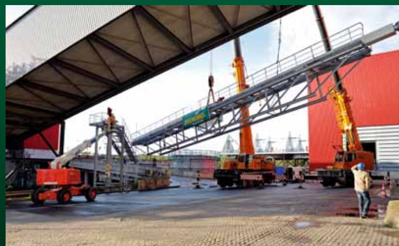
Vormontierter Förderweg in Bremen