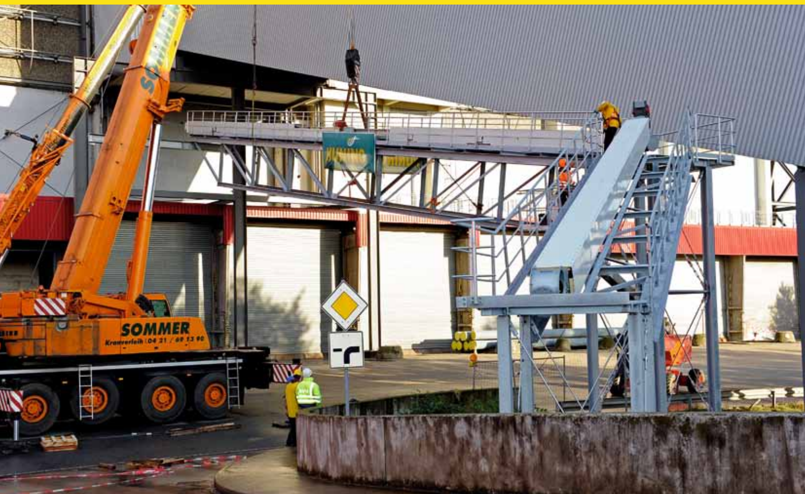
Förderweg Müllheizkraftwerk Bremen