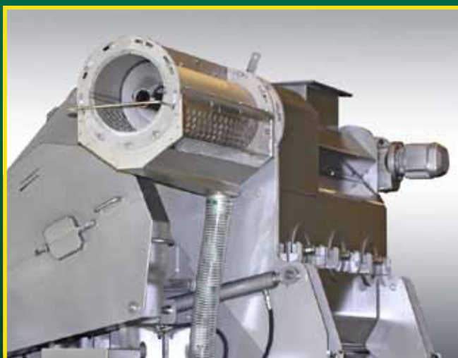
Ausschleusung von Verpackungsmaterial mittels Spiralförderer/Nachabtrennung von organischen Substratresten durch eine Verstellsiebeinheit