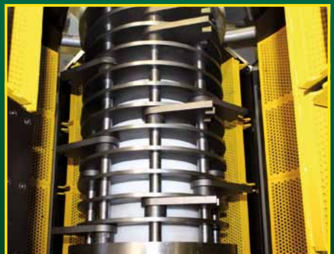
Robustes Schlagwerk mit seitlichen Siebkörben zur Erzielung eines definierten Trenngrades < 10 mm als Vorbereitung für die Hygienisierungsstufe