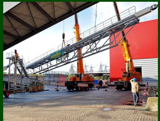
Vormontierter Förderweg in Bremen

Huning Maschinenbau GmbH Wellingholzhausenerstr. 6 D-49324 Melle