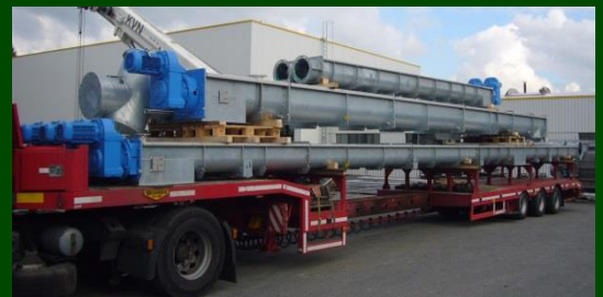
Förderweg Klärschlammprojekt Moskau