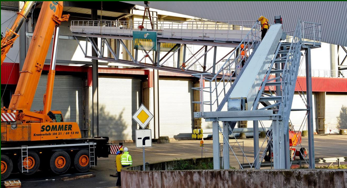
Förderweg Müllheizkraftwerk Bremen